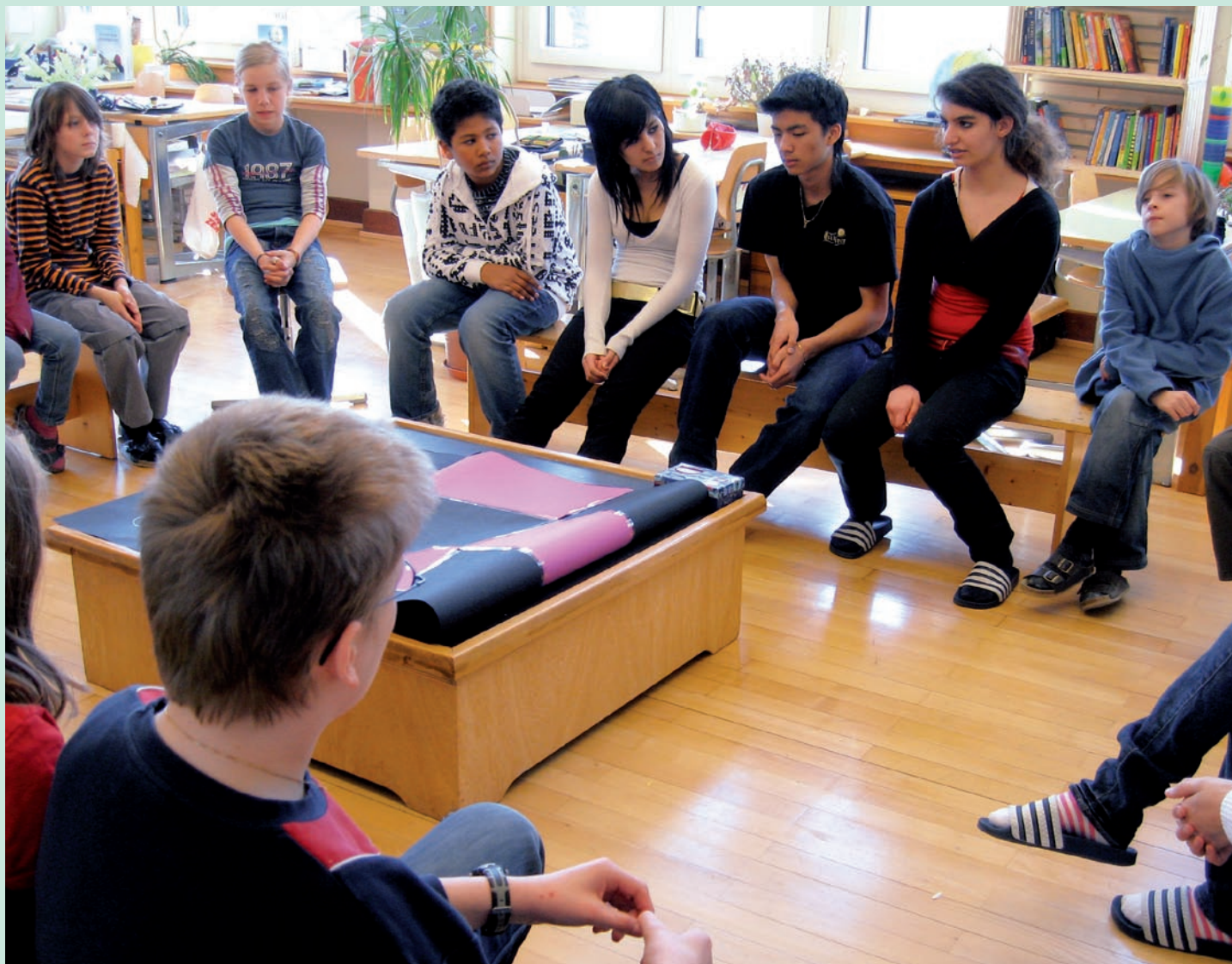
Heterogenität als Chance: Viert- bis Sechstklässler lernen zusammen.

ADL ist keine Fluggesellschaft und auch kein Begriff aus der Elektronik-Branche. ADL, Kurzform für Altersdurchmisches Lernen, nennt man heute ein pädagogisches, dynamisches Lernmodell, das vermutlich eine grosse Zukunft vor sich hat. Text und Fotos: Esther Mogenicato.